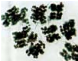
ミクロキスティス

琵琶湖でアオコを形成する種類は、アナベナやミクロキスティス等、15種類程度が観察できます。しかし、それらは形が似ているため、種類の同定が難しいのが現状です。そこで今回、琵琶湖に住むアオコ形成種について双眼生物顕微鏡の観察やスケッチを行い、また、アオコ種の消長に関する専門知識を習得します。